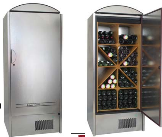
VSM 1-54 Edelstahl Ausführung