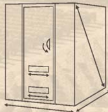
VSP weinkeller mit groer kapazität