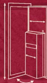
VSE einrichtungs- gegenstände