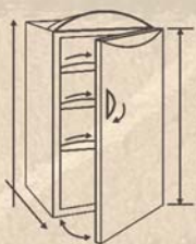
VSI individuelle weinschränke

der hersteller behält sich das recht vor, seine modelle ohne vorankündigung zu verbessern oder zu verändern