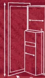
VSE Construction ou aménagement cave existante