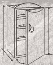
VSI Armoires individuelles

Photos non contractuelles – le fabricant se réserve le droit de modifier ou d'améliorer ses modèles