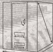
VSP Espaces caves grande capacité