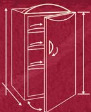
VSI individuelle weinschränke

www.vinosafe.com 2 rue des Artisans F-68280 Sundhoffen France +33 (0)3 89 71 45 35