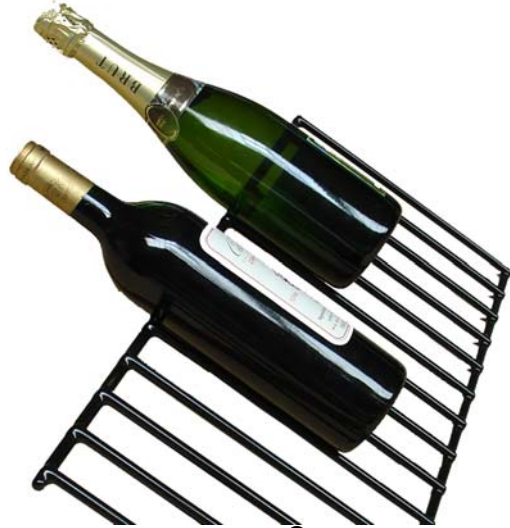
VinoBlock® (Anti-Rutsch und Vibrationsfrei)

Die waagerechte Roste gibt es in 2 Ausführungen: