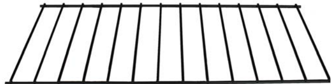
Standard (verzinkt mit schwarze Epoxy Lackierung)

Regal-Vorderseiten aus Edelholz (Esche) in 3 Ausführungen :