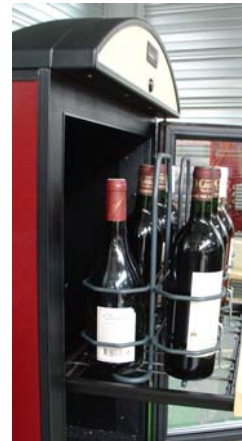
Senkrecht mit integriertem Flaschenträger

www.vinosafe.com 2 rue des Artisans F-68280 Sundhoffen France +33 (0)3 89 71 45 35