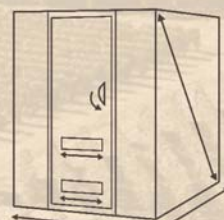
VSP weinkeller mit grosser kapazität