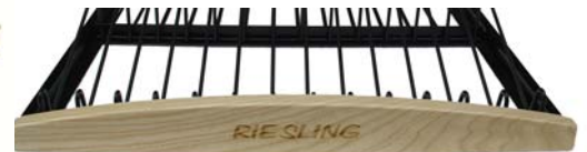
Abgerundet (Personalisierung durch Laser-Gravur möglich)

Unsere Regale lassen sich einfach reinigen :